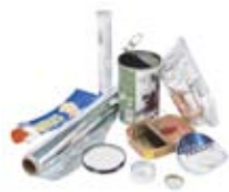
Metall- förpackningar Metal cans etc. Metall- verpackungen