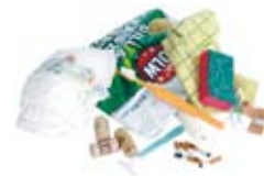
Brännbart Burnable waste Brennbares