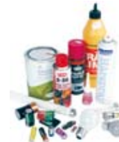
Farligt avfall Hazardous waste Gefährlicher Abfall