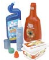
Hårdplast- förpackningar Hard plastic packaging Harte Plastik- verpackungen