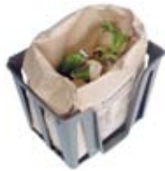
Kompost Compostable organic waste Kompost