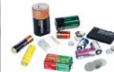
Batterier Batteries Batterien

Var lämnar jag mitt avfall? Tala med hyresvärden! Where do I put my sorted garbage? Have a word with your landlord! Wohin mit meinem Abfall? Sprechen Sie mit dem Vermieter!