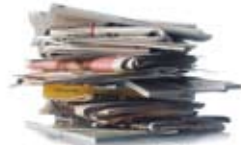
Tidningar och trycksaker Paper and printed matter Papier und Drucksachen