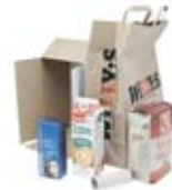
Pappers- förpackningar Paper cartons and packaging Verpackungen aus Papier